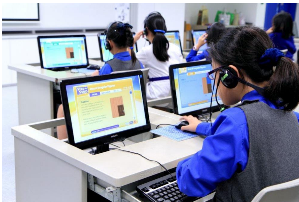
Slika 3. Prikaz multimedijskog učenja 31