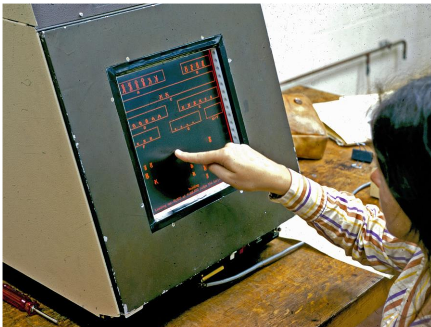
Slika 2. PLATO terminal 23

obrazovne materijale za velik broj korisnika projekta. Materijali su sadržavali informacije u raznim formama (tekstovi, grafikoni, tablice, animacije), a izrađivali su se u programskom jeziku TUTOR. Obrazovni materijali bili su posloženi na način da se s jednostavnijih sadržaja prelazilo na složenije. Korisnici su odgovarali na postavljena pitanja pritiskom na određenu tipku, upisivanjem određenog izraza i sl. Zatim su dobivali povratne informacije kako bi mogli pratiti svoj napredak u učenju. Povratne informacije bi bile pozitivne u slučaju učenikovog uspješnog rješavanja zadatka, a negativne u slučaju kada bi učenik neuspješno riješio zadatak. 22