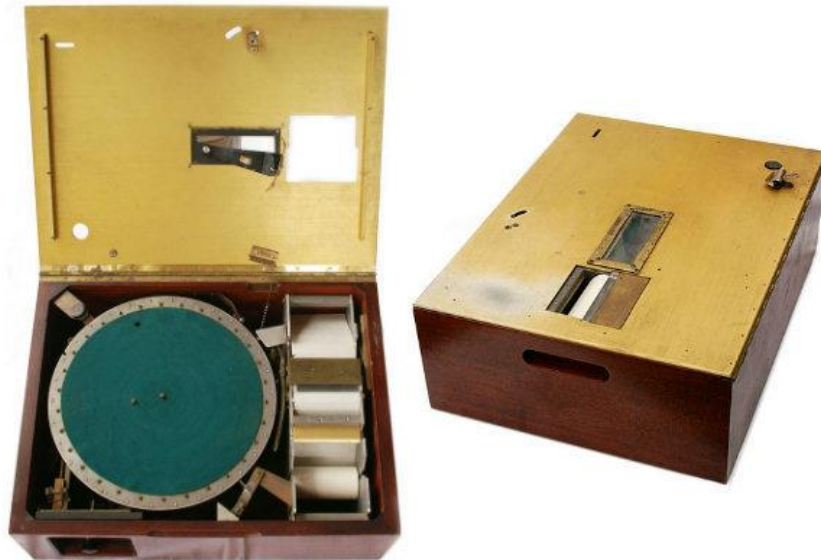
Slika 1. Skinnerova naprava za učenje 20

Nakon Drugog svjetskog rata Skinner je razvio koncept programirane nastave. U okviru nje su sadržaji bili podijeljeni u manje cjeline pa su učenici prelazili gradivo u manjim koracima. Programirana nastava se temeljila na operantnom uvjetovanju. Naime, učenik bi nakon svakog dijela morao riješiti zadatak, dobivajući povratnu informaciju o točnosti rješenja. Učenikovo napredovanje ovisilo je o uspješnosti rješavanja zadataka. Oni učenici koji bi riješili određeni zadatak uspješno, mogli bi prijeći na sljedeći obrazovni sadržaj i bili bi pohvaljeni (nagrada), dok bi oni učenici koji ne bi uspješno riješili zadatak dobili dodatna pojašnjenja i neki dodatni zadatak (kazna). 21