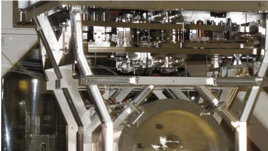
Slika 2 Dio složenog LIGO sustava [8]

svjetlost bila poništena, pri čemu svjetlost ne dolazi na fotodiodu. Kada gravitacijski val prođe kroz interferometar, udaljenosti između ruku interferometra smanjuju se i produžuju, uzrokujući stanje u kojem su zrake izvan faze. Ovo rezultira dolaskom zraka u fazu, stvaranjem rezonancije i dolaskom svjetlosti na fotodiodu, nakon čega se uočava signal. Svjetlost koja ne sadrži signal vraća se u interferometar korištenjem power recycling zrcala čime se povećava snaga svjetlosti u krakovima. [4]