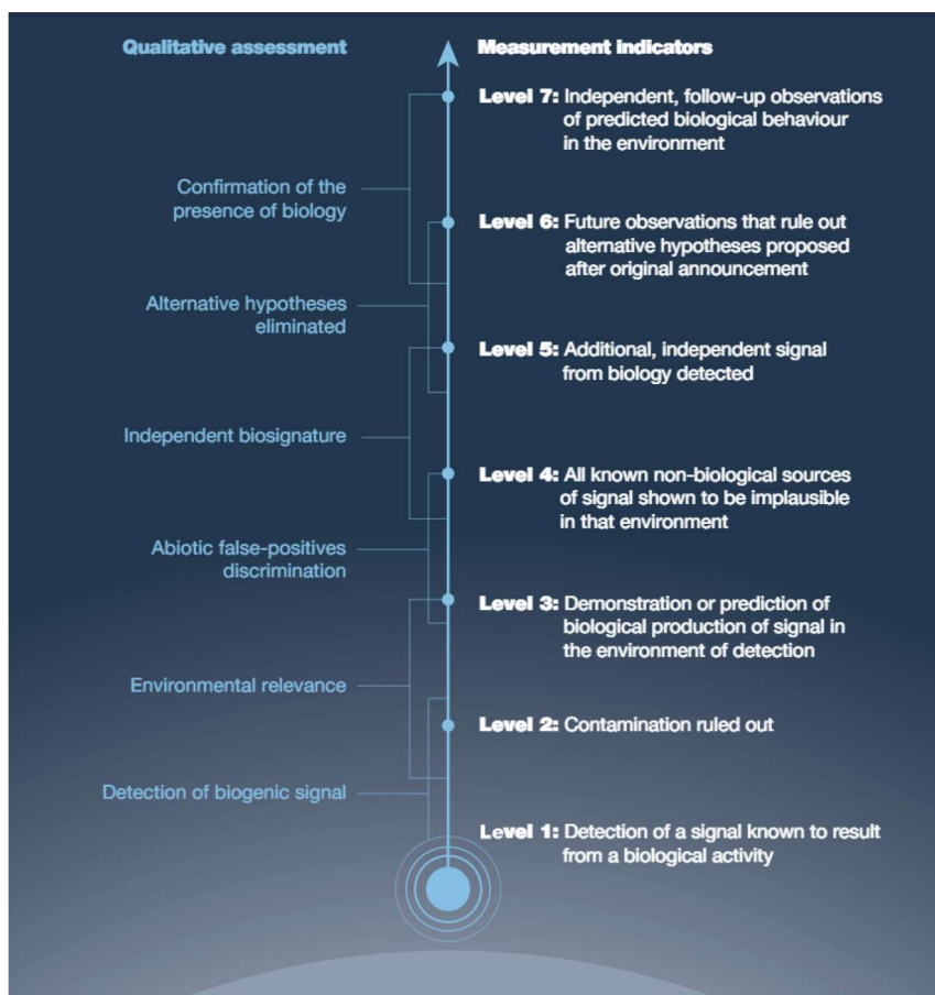
Slika 3.1: Slika je preuzeta iz rada Nature 598 (2021) 575–579.