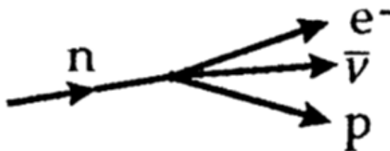
Slika 1. Raspad neutrona na elektron e^- , antineutrino \bar{\nu} i proton p (slika preuzeta iz [1]).

Ta energija je raspoređena između neutrina i elektrona. Prema današnjim eksperimentima masa mirovanja neutrina je manja od 20 eV, je različita od nule. No zbog jednostavnosti i lakšeg razumijevanja aproksimiramo je nulom. Beta raspadom neutron se raspada u proton, uz zračenje elektrona i antineutrina, što je grafički prikazano na Slici 1. [1].