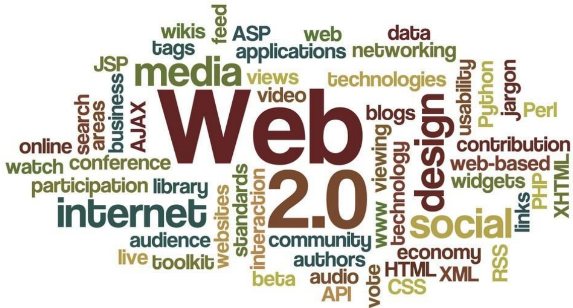
Slika 5. Elementi Weba 2.0 49

Krstić i Krstić 50 u grupu osnovnih Web 2.0 alata namijenjenih e-učenju svrstavaju blog, wiki, društvene mreže, podcast, društveno označavanje i mentalne mape. Blog, kao svojevrsni web dnevnik, sastoji se od kronološki organiziranog teksta periodičnog karaktera, koji se prikazuje u obrnutom vremenskom slijedu, a kojeg čitatelji mogu komentirati, čime se ostvaruje interakcija između sudionika u nastavnim procesu te potiče razmjena mišljenja i diskusija. Wiki predstavlja zbirku web stranica s različitim informacijama kojoj svatko može pristupiti i modificirati sadržaj, što je ujedno njezina prednost i mana. Društvene mreže omogućavaju korisnicima povezivanje, komunikaciju, stvaranje grupa i razmjenu raznih vrsta sadržaja te stoga imaju sve važniju ulogu u obrazovanju. Podcast predstavlja digitalnu datoteku koja sadrži audio ili audio/video zapis, koji se distribuira putem weba, a obično se koristi kako bi se nadoknadio ili dopunio neki nastavni sadržaj. Društveno označavanje omogućava sudionicima u nastavnim procesu da čuvaju, klasificiraju, pretražuju i razmjenjuju adrese omiljenih web stranica. Mentalne mape, za čije se kreiranje koriste posebni Web 2.0 alati, predstavljaju vrstu shematskog prikaza informacija koji omogućava njihovo lakše i brže usvajanje, organiziranje i pamćenje.