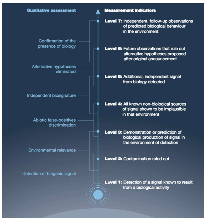
Slika 3.1: Slika je preuzeta iz rada Nature 598 (2021) 575–579.