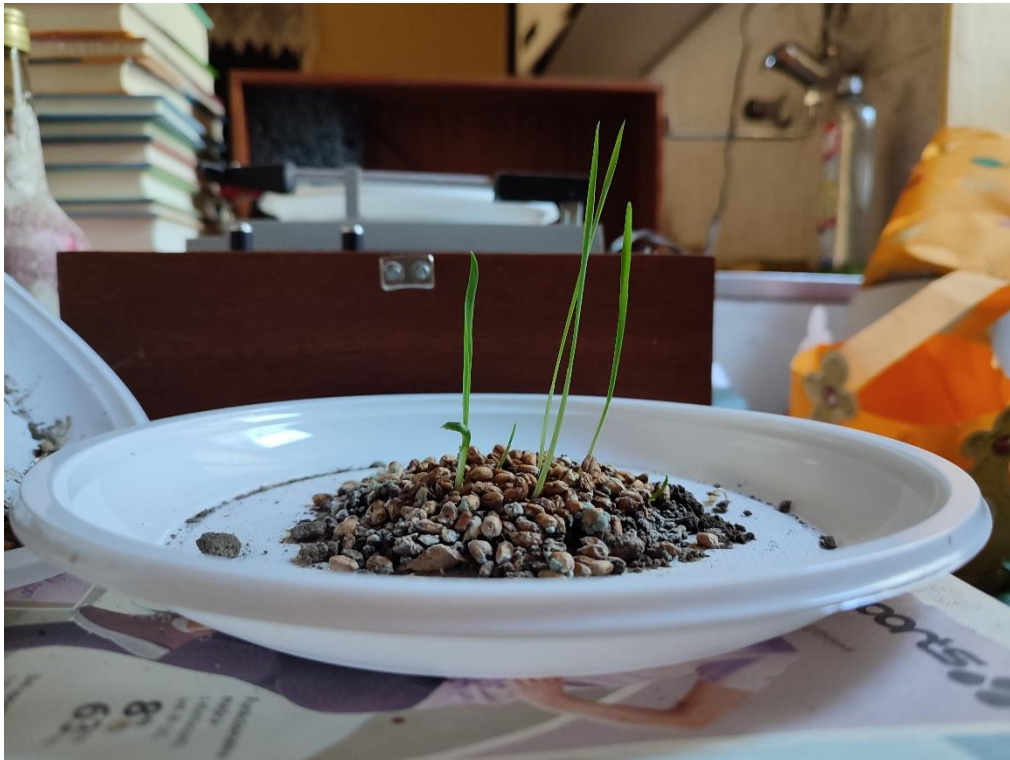
Slika 2. Rast pšenice na mirnoj horizontalnoj podlozi

Geotropizam se lako može pokazati pomoću žitarice pšenice. Kada bismo posadili pšenicu na mirnoj horizontalnoj podlozi, lako se možemo uvjeriti da će pšenica rasti suprotne orijentacije od orijentacije sile teže.