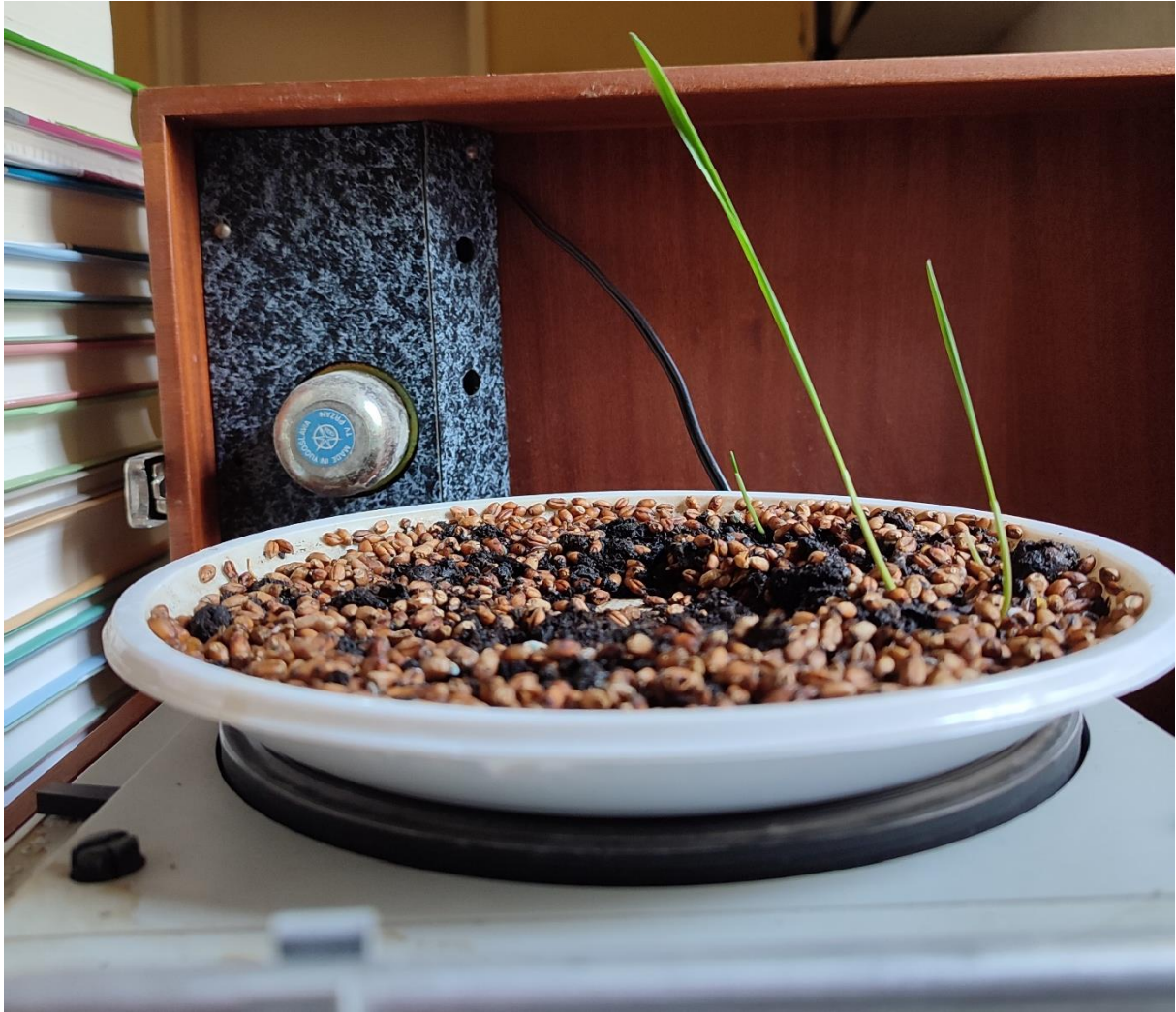
Slika 4. Prikaz pšenice koja raste na rotirajućoj gramofonskoj plohi

Kako bi shvatili ovisnost kuta nagiba prema osi rotacije, raspisujemo trigonometrijsku funkciju tangensa kuta između efektivne sile teže i centrifugalne sile.