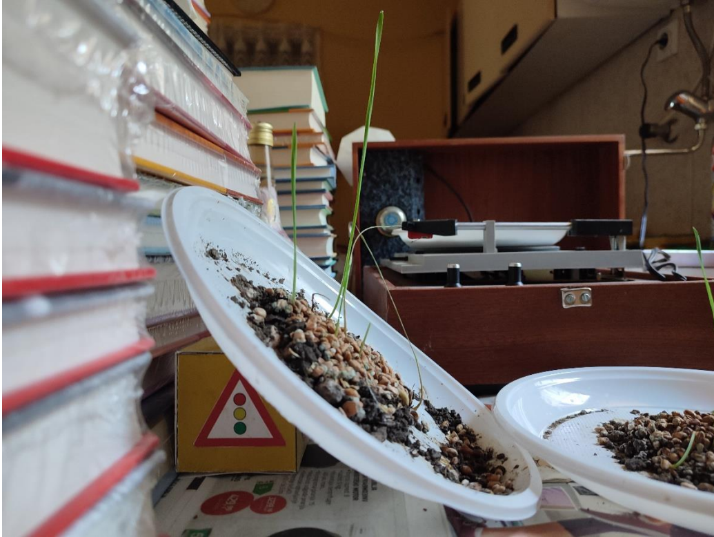
Slika 3. Rast pšenice na mirnoj kosini

Ali ako bi pšenice posadili na mirnoj kosini, iz prethodno objašnjene definicije geotropizma se može shvatiti kako će stabljika, bez obzira na kut nagiba podloge, rasti u istom smjeru kao i na mirnoj podlozi – suprotno od sile teže.