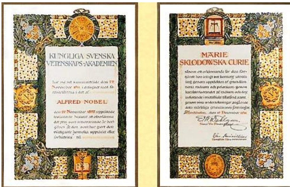
Slika 10. Nobelova nagrada za kemiju 1911. godine