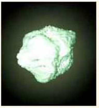
Slika 4. Radij

Röntgenovih zraka, Marie se zainteresirala za Becquerelovo istraživanje. Započela je s istraživanjem minerala koje sadrže uranij. Otkrila je da jačina zračenja ovisi o količini uranija u mineralu. Nije igralo ulogu kojeg je mineral odnosno spoj sastava, je li mokar ili suh, za određenu količinu radijacije bila je važna samo količina atoma uranija u spoju odnosno mineralu. Radijacija nije bila posljedica samo uranija. Isprobavajući razne kemikalije otkrila je da i torij također zrači. Kako bi opisala ponašanje ovih dvaju elemenata smislila je naziv radioaktivnost. 18 Marie je posumnjala da se u ovim spojevima/mineralima nalazi nova tvar koja je radioaktivna