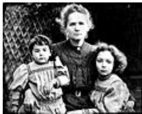
Slika 11. Marie s kćerima.

Marie je rodila dvoje djece: Irene 1897. i Eve 1904. godine. Bila je požrtvovna majka koja je brinula o intelektualnom i tjelesnom odgoju svojih kćeri. Međutim, imala je vlastite ideje o odgoju djece. Pomno je i pažljivo pratila njihove sposobnosti i potencijale te u svom sivom notesu pravila bilješke o Ireneinim dostignućima na području matematike i Eveinom uspjehu u svijetu glazbe.