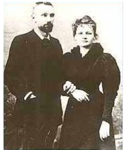
Slika 2. Marie i Pierre Curie

Pierre Curie je imao laboratorij pa se s njim upoznala u proljeće 1894. godine. On je bio šef laboratorija na Pariškoj školi za industrijsku fiziku i kemiju. Iako u Francuskoj gotovo