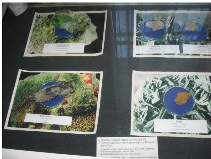
Slika 9. Minerali koji su dobili ime prema Curievima

Curiejevih mjerna jedinica za radioaktivnost izvan SI-sustava mjera nazvana je kiri (Ci). Izvorno je jedan kiri bio jednak radioaktivnosti jednog grama radija 226. Po njima su nazvani i kirij, umjetno sintetiziran kemijski element sa simbolom Cm i atomskim brojem 96, kao i radioaktivni minerali sklodovskit i kuprosklodovskit. 69