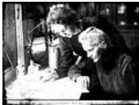
Slika 7. Marie Curie i kćer Irene

Marie i Paul Langevin upoznali su se još 2. lipnja 1903. godine, na dan kada je obranila svoju doktorsku disertaciju. 48 Paul je bio učenik Pierrea Curiea koji je 1907. dao svoj najveći prilog fizici: primjenu teorije elektriciteta na fenomen magnetizma. 49 Marie se s oženjenim Paulom upušta u ljubavnu aferu i 15. srpnja 1910. godine zajedno unajmljuju stan koji im je služio samo za sastanke. 50 Njihova je sreća potrajala samo šest mjeseci. Žena Paula Langevina pronašla je ljubavno pismo koje je Marie uputila Paulu i zaprijetila joj smrću.