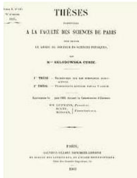
Slika 5. Naslovna stranica teze Marie Curie

Ta mlada žena stoji 25. lipnja 1903. pred školskom pločom u maloj dvorani na Sorbonni do koje dođeš po sakrivenim pužastim stepenicama. Prošlo je više od pet godina otkako je Marie započela pripremati svoju disertaciju. U vrtlogu koji je prouzročilo ogromno otkriće, dugo je odgađala s prijavom za doktorski ispit jer nije niti imala vremena prijaviti se na nj. Danas stoji pred svojim sucima. 36