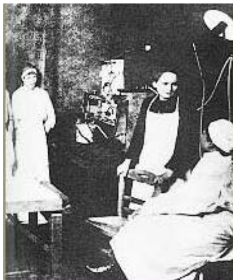
Slika 12. Marie Curie obučava žene

Kako je njemačka vojska marširala prema Parizu, vlada se odlučila skloniti u Bordeaux. Čitava zaliha radija sastojala se tek od jednog grama što ga je Marie imala u svome laboratoriju. Na vladino inzistiranje pošla je s njima vlakom u Bordeaux, zajedno s gramom radija koji je nosila u olovnoj kutiji. Za razliku od mnogih, smatrala je da joj je mjesto u Parizu. Nakon što je položila radij u sigurnosni pretinac u Bordeauxu, vratila se u Pariz vojnim vlakom. Shvatila je da X-zrake mogu spasiti živote vojnika jer mogu pomoći doktorima da vide metke, šrapnele i slomljene kosti. Uvjerila je vladu da joj omogući da osnuje prve francuske radiološke centre. Imenovana je ravnateljicom radiološke službe Crvenoga križa pa je prikupljala novac i vozila od bogatih poznanika. Uvjerila je tvornice automobila da preinače vozila u kombije i molila proizvođače da doniraju opremu. Do konca listopada 1914. godine prvih 20 radioloških vozila bilo je spremno za rad. Nova su vozila dobila neslužbeni naziv petites Curies (mali Curies).