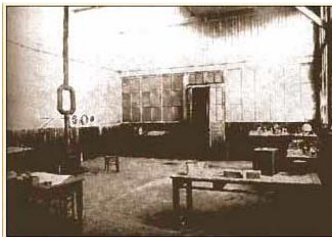
Slika 6. Laboratorij u kojemu je izoliran čisti radij

Marie i Pierre Curie tako su izabrali siromaštvo. Bilo kako bilo, priznanja su samo stizala. Kraljevsko društvo Londona odlikovalo je nju i Pierrea, Davyjevom medaljom, a 1904. godine Talijani su im dodijelili Matteuccijevu medalju (vidi Prilog 1). 38 Međutim, njihovo se zdravstveno stanje pogoršavalo pa do 1905. godine nisu posjetili Švedsku kako bi održali govor i preuzeli nagradu. Ta im je nagrada, što se može pročitati iz Marieinog pisma bratu Josephu, značila puno jer je iznosila oko sedamdeset tisuća franaka. 39 Samo godinu dana kasnije, 19. travnja 1906. godine, nakon rada u laboratoriju Pierre je krenuo u knjižnicu, poskliznuo se na mokroj cesti i pao pod zaprežna kola. Umro je na mjestu. Jedanaest dana nakon muževe smrti Marie je počela voditi dnevnik preko kojega je tugovala za suprugom. 40 O njegovoj smrti pisala je Blanche: